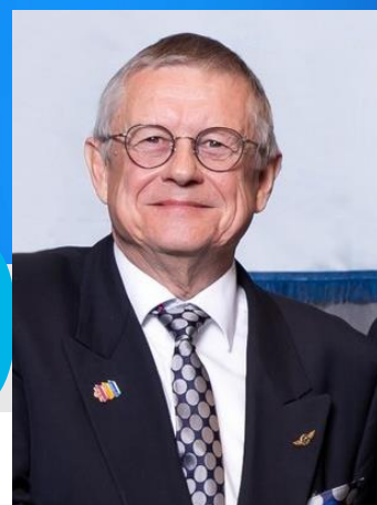
Governor 2020/21 Thomas Fink