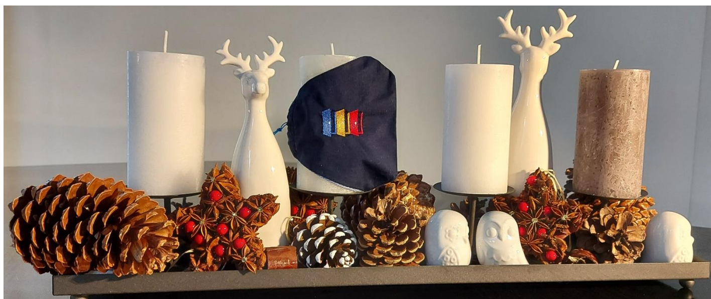
Rotarischer Advent im Jahre 2020

PS: Wenn Sie ein gewisses Wort vermissen in diesem Brief, ich habe es absichtlich vermieden!