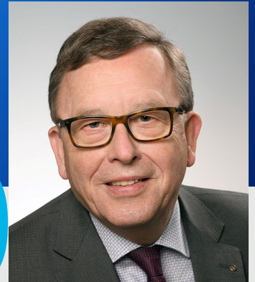
Governor 2022/23 Armin Staigis