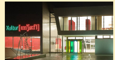
Kulturhaus im Schöffl • Engwitzersdorf 13. Juni 2018, 19.30 Uhr