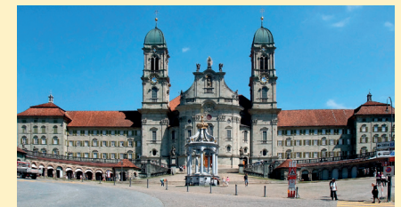
Kloster Einsiedeln • Zürich 17. Juni 2018, 16.30 Uhr