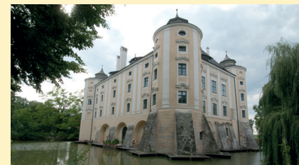
Schloss Bernau • Fischlham 14. Juni 2018, 20 Uhr